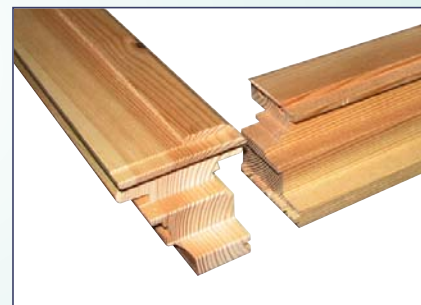
CICLI SPECIALI nel caso di telai sottili/delicati o infissi prefiniti SPECIAL CYCLE in case of light or pre-finished frames