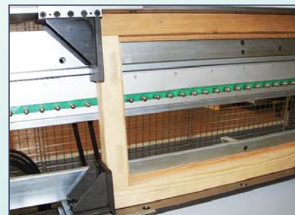
barra griglie sdoppiata a passo variabile bar in two parts with variable pitch