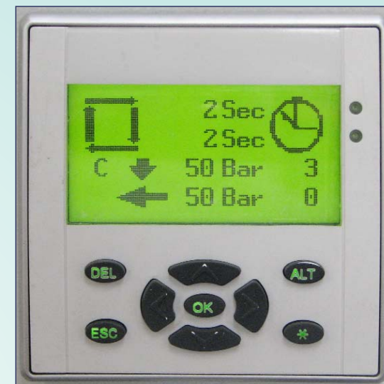
Interfaccia DIGITALE Operator interface