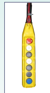
Pulsantiera pensile Hanging push-button strip